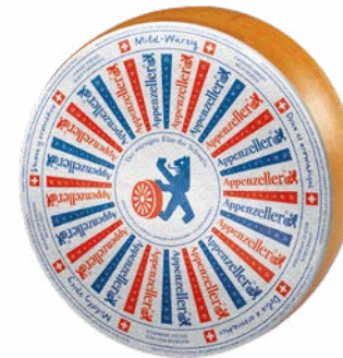
Mild-Würzig Doux et aromatique Affinage : 3 mois

Bien sûr, la nature seule ne suffit pas à créer une grande spécialité fromagère. Le savoir-faire doit impérativement s'y allier. Or, dans ce périmètre de production aussi protégé que limité (il englobe les demi-cantons d'Appenzell Rhodes-Intérieures et d'Appenzell Rhodes-Extérieures ainsi que certaines parties des cantons de St Gall et de Thurgovie) la tradition se perpétue. Immuable. Soins de tous les instants, recette de saumure aux herbes baptisée la « Sulz » jalousement gardée. Tel est le secret de la naissance d'un grand fromage.