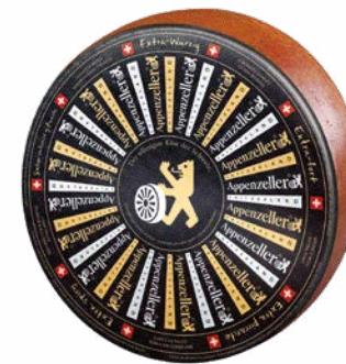
Extra-Würzig Extra-fort Affinage : min 6 mois