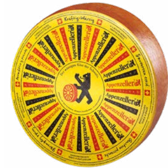
Kräftig-Würzig Savoureux corsé Affinage : 4 à 6 mois