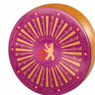
Edel-Würzig Raffiné et corsé Affinage : 9 mois